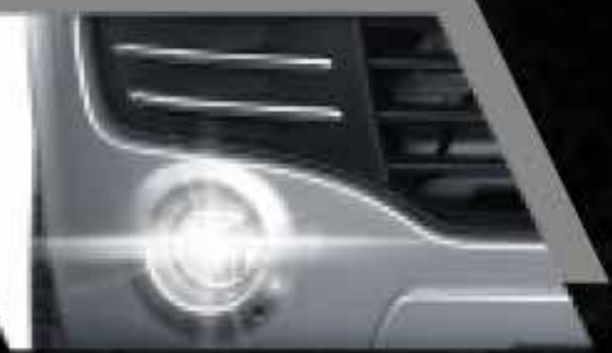
Neblineros delanteros y posteriores