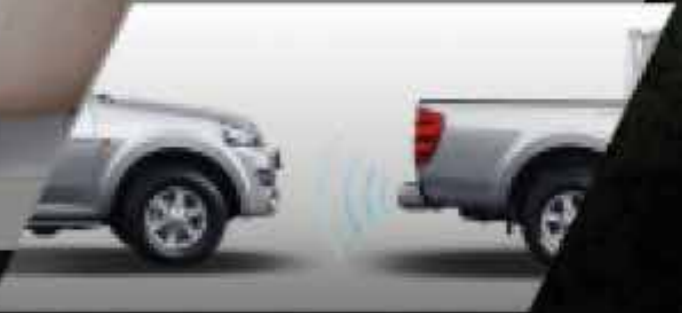
Sensor de retroceso