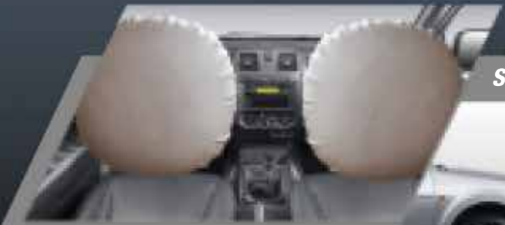
Doble airbag frontal