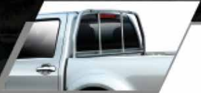
Protector de luna posterior sobre tolva