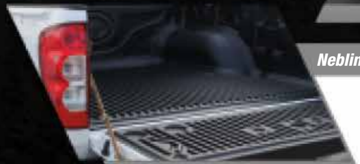
Capacidad total de tolva: 480 kg